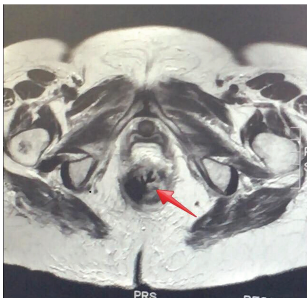
Figura 2 - RESSONÂNCIA MAGNÉTICA DE Pelve – seta apontando lesão de contornos irregulares, compatível com neoplasia primária de reto conforme colonoscopia prévia.

com esofagogastroplastia e abordagem da região colorretal pela equipe de Coloproctologia da Santa Casa de Misericórdia de São Paulo.