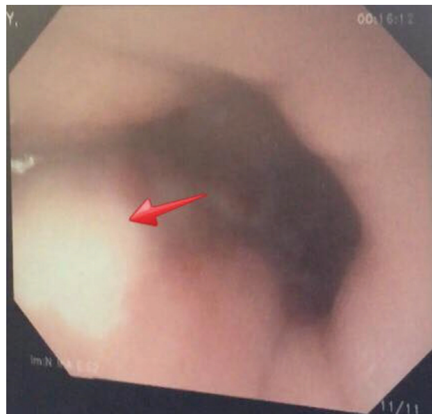
Figura 3 - EDA – seta apontando região de alteração de mucosa sugestiva de metaplasia.

Na literatura, muitas combinações de tumores sincrônicos do trato gastrointestinal são relatadas